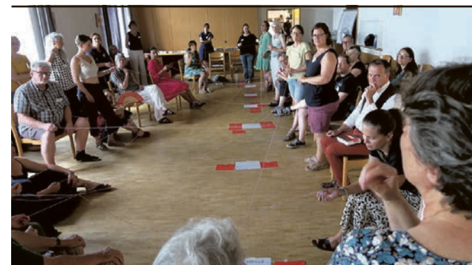
Innerbiblische Verbindungen werden sichtbar gemacht.