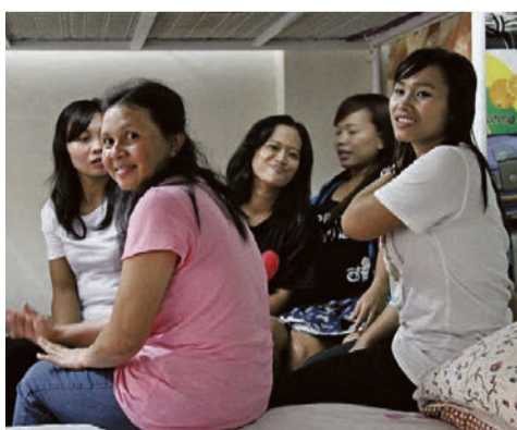
Zufucht in der Schutzunterkunft in Hongkong.

Wir stehen den Frauen bei. Wir bieten ihnen eine geschützte Unterkunft und unter-