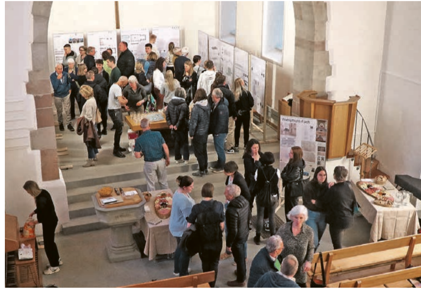
Ausstellung der Projektarbeiten in der Städtlikirche Neunkirch.