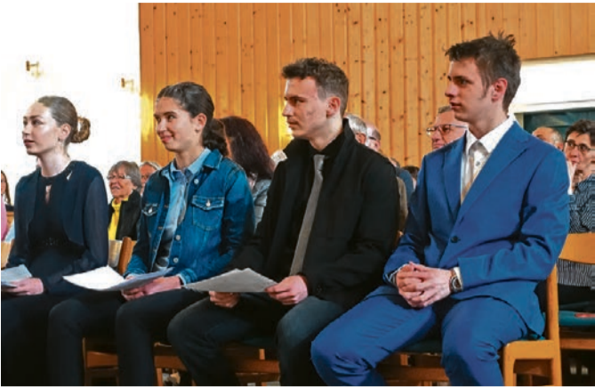
Konfirmation 2024.

Angesprochene Kirchgemeinden (Beg): Beggingen, (Hall): Hallau, (Gäch): Gächlingen, (Lô-G): Löhningen-Guntmadingen (Sib): Siblingen, (Schl): Schleitheim, (Neu): Neunkirch (Ober): Oberhallau, (TOW): Trasadingen-Osterfingen-Wilchingen