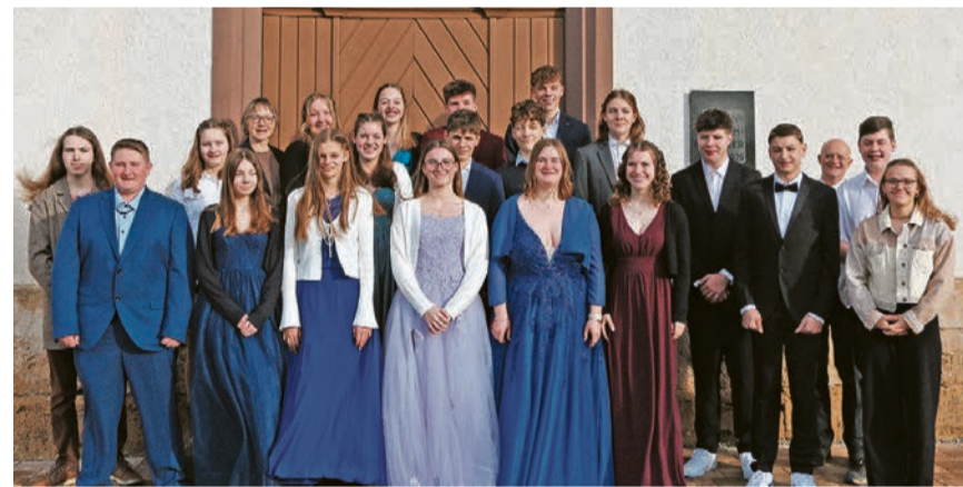
Konfirmanden 2024 und Konf-Team.