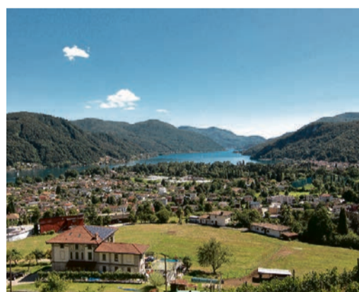
Beim Blick über Magliaso kommt Ferienstimmung auf!

Sonntag, 5. Mai, 17 Uhr, reformierte Kirche Meggen