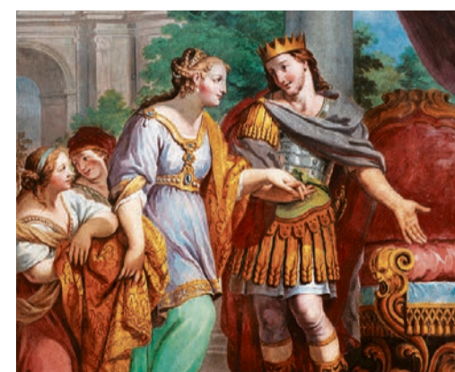
Esther und König Xerxes, Fresko von Pietro Paolo Vasta, Chiesa di San Camillo, Italien

Samstag, 28. September, bis Samstag, 5. Oktober, Magliaso