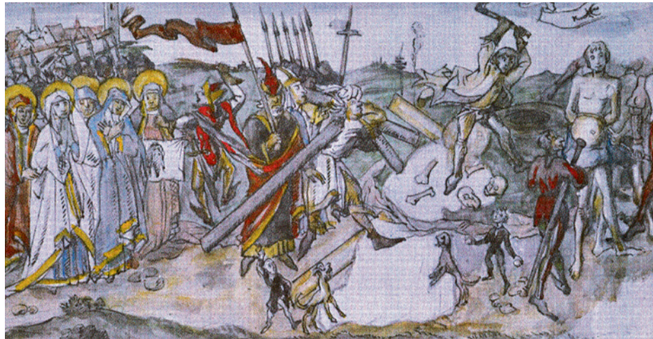
Kreuztragung um 1500 in St. Johann – mit der ältesten bekannten Ansicht Schaffhausens.

Auch in Schaffhausen beginnt der Weg im Zentrum der Stadt beim Münster zu Allerheiligen. Von dort führt er hinaus