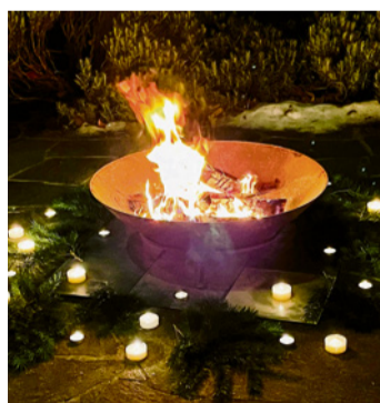
Osterfeuer: Licht in unserer Nacht.