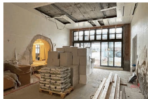
Der neue Pfarrsaal mit Bogendurchbruch ins Pfarrhaus.