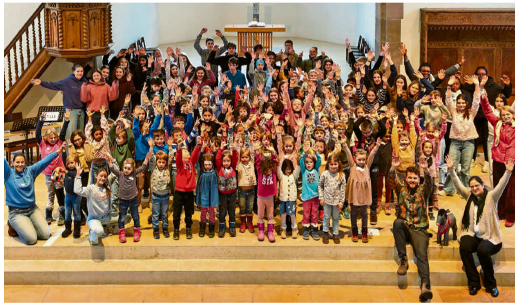
Die 81 Kinder haben an den Ostertagen viel erlebt.