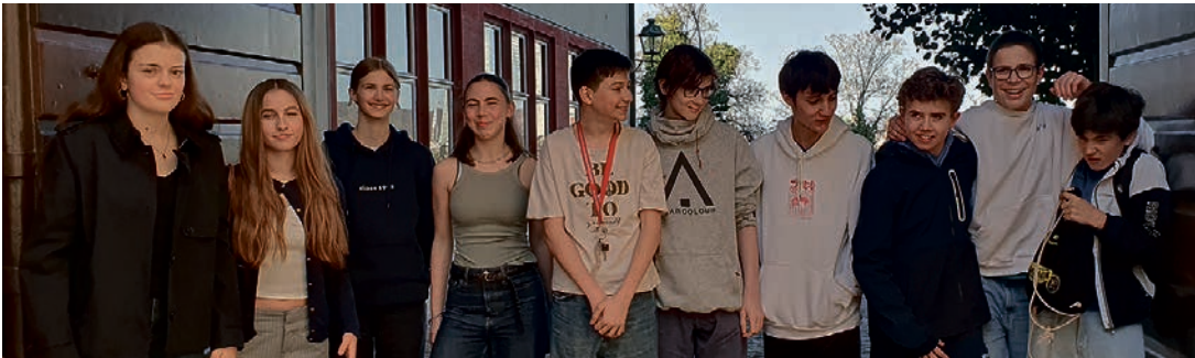
Zwei Jahre kirchlichen Unterrichts finden mit dem Konfirmationsgottesdienst einen feierlichen Abschluss.

Nach zwei Jahren kirchlichem Unterricht und zwei gemeinsamen Lagern werden 12 Jugendliche der Münstergemeinde am Sonntag, 25. Mai, konfirmiert. Noch sind die Erinnerungen an das abwechslungsreiche Konfirmandenlager in Lenz GR lebendig: Workshops, Wanderungen, leckeres Essen, die mystische Stimmung in der Kirche