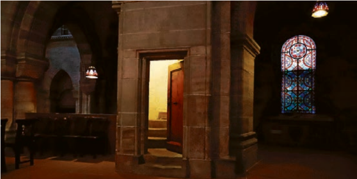
Nachts im Münster herrscht eine geborgene und zugleich geheimnisvolle Atmosphäre.

Für Jugendliche der 5. bis 7. Klasse wird von Samstag, 10. Mai, bis Sonntag, 11. Mai, ein ganz besonderes Camp angeboten. Wir essen und spielen gemeinsam und entdecken Geheimnisse des Basler Münsters. Nach einer Nacht im Münster findet mit dem Sonntagsgottesdienst das Lager seinen feierlichen Abschluss. Zum Gottesdienst um 10 Uhr im Münster sind die Familien der Teilnehmenden ebenfalls herzlich eingeladen. Informationen und Anmeldetalon zum Download: www.baslermuenster.ch/kirchliches-leben/jugendliche/nachts-im-muens-ter . Anmeldeschluss: 30. April. Die Teilnehmerzahl ist begrenzt.