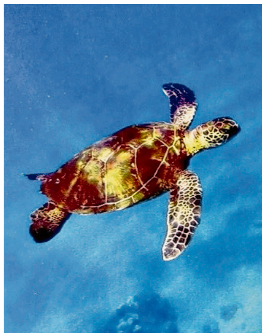
Meeresschildkröte auf ihrem Weg durch die Weiten des Ozeans. Sie erinnert daran, dass wahre Weisheit nicht in Hast liegt, sondern in Frieden und Beständigkeit. ANDREAS MARTI