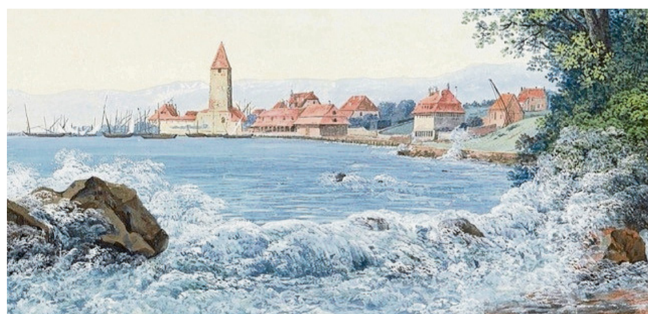
Carl Ludwig Hackert – Vue d'Ouchy. zvg