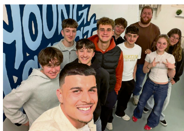
Viel Spass mit den FCB-Spielern.

auch zum FCB hat er sich jeweils mit KI seine passende Kirche vorschlagen lassen. Die Jugendlichen hatten sehr viel Freude und sind dankbar, dass die beiden Spieler sich mit ihnen auf Augenhöhe ausgetauscht haben. Ein unterschriebenes Trikot hängt nun an der Wand im Jugendraum. SASCHA EBENER, SOZIALDIAKON IN AUSBILDUNG