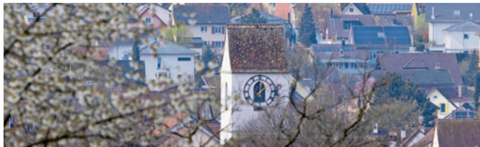
Der Kirchturm der reformierten Kirche PETER WEHRLI