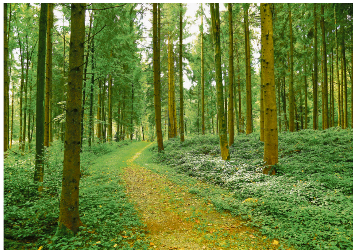
Willkommen zum ökumenischen Gottesdienst bei der Waldhütte im Hasliwald.

Freitag, 26. Juni, 12 Uhr, reformiertes Begegnungszentrum, Ronmatte 10, Buchrain