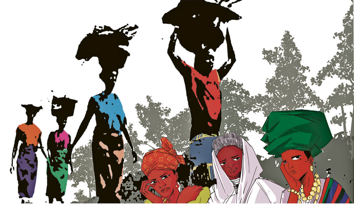
«Ruhe für die Erschöpften» von Gift Amarachi Ottah.

Hoffnung Am Freitag, 6. März, feiern wir den Weltgebetstag in Allschwil um 19 Uhr im reformierten Kirchli an der Baslerstrasse 220. Dazu möchten wir sie herzlich einladen. «Kommt, bringt eure Last!», lautet das hoffnungsverheissende Motto, angelehnt an Matthäus 11, 28–30.