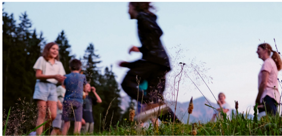
Im Sommerlager sind erlebnisreiche Tage garantiert. ADRIAN MINDER