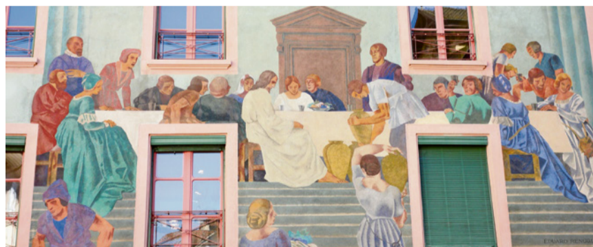
Wandbild Eduard Renggli, Weinmarkt Luzern, 1928. MARCEL KÖPPLI

Im Gottesdienst am 7. Juni steht diese Geschichte des Weinwunders im Zentrum. Die Stimmung des Bildes