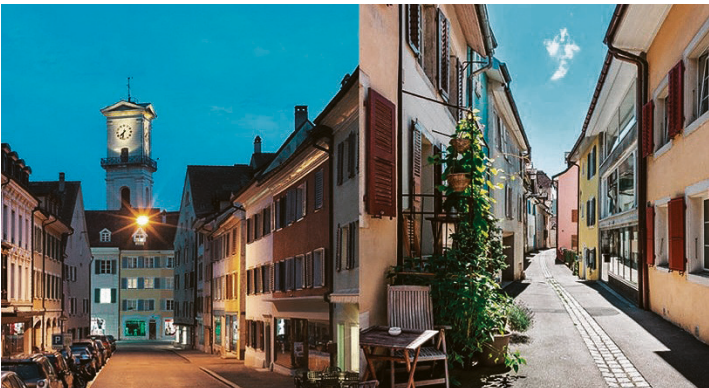
Église St-Marcel und Altstadt von Delémont.