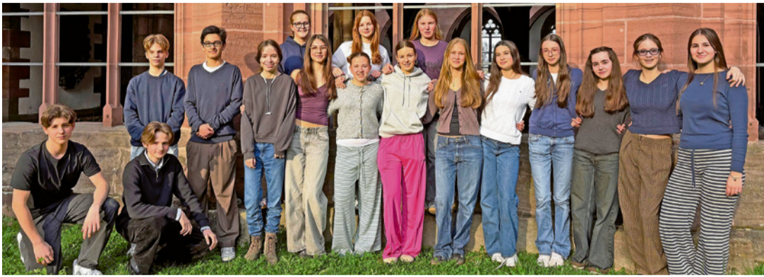
Die diesjährigen Konfirmandinnen und Konfirmanden.