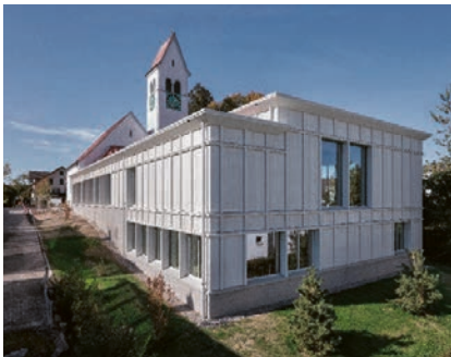
Kirchgemeindehaus Sursee. CHRISTIAN HARTMANN

ausgestellt und im Schweizer Architektur-Jahrbuch 2025/26 wird es mit einem Bild und einem Kurztext präsentiert.