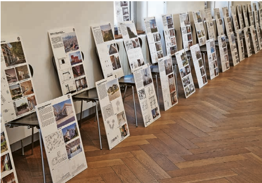
Ausschnitt aus der Ausstellung im Schweizerischen Architekturmuseum Basel, im Vordergrund das Plakat mit der Vorstellung des Surseer Kirchgemeindehauses. C. MARTI, 16. OKTOBER 2025

Unter diesem Motto liessen sich rund 75 freiwillige und angestellte Mitarbeitende unserer Kirchgemeinde zum Dankesfest nach Gunzwil einladen. Passend zum Motto wurden die Gäste gebeten, mit einem Hut zu erscheinen. Vom Cowboyhut über eine Polizeimütze bis hin zur Pelzkappe war alles dabei und sorgte bereits beim Eintreffen für Erheiterung (und teilweise Schwierigkeiten beim Erkennen der Leute). Nach einer Begrüssung und ein paar Dankesworten durch das OK folgte ein Grusswort durch Yvonne Zemp, die Sozialvorsteherin von Sursee. Auch sie dankte den Anwesenden für ihr Engagement und allgemein für die gute Zusammenarbeit zwischen Stadt und Kirchgemeinde. Ein feines Essen sorgte für zufriedene Gesichter und vollen Genuss. Serviert haben der Kirchenvorstand und die hochprozentig Angestellten: auch dies eine Geste des Dankes an alle ehrenamtlich Engagierten. Nach dem Hauptgang erhielt Sozialdiakon Andreas Müller das Wort: Er habe einen Brief vom Synodalrat erhalten, um eine Qualitätssicherung unter den freiwillig Engagierten der Kirchgemeinde durchzuführen. Die Anwesenden wurden in drei Gruppen aufgeteilt, die dann jeweils zwei Vertreter delegierten. Diese wurden in den Disziplinen «Ekklesia-Capulu-Abilität» – der Kirchenkaffee-Tauglichkeit, «Ekklesio-Kanto-Abilität» – der Kirchengesangskompetenz,