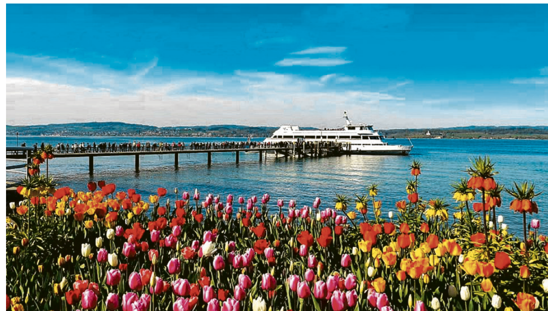
Eine herrliche Blumenpracht empfängt Sie!