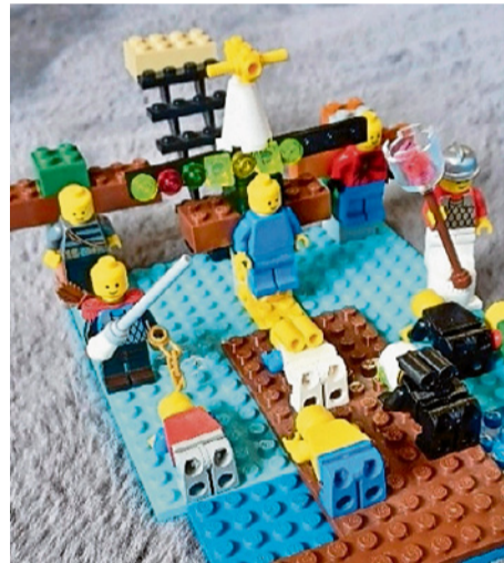
Welche Szene aus der Passionsgeschichte könnte das sein?

Übrigens: Am 14. Juni findet in Läufelfingen ein Gottesdienst statt, den die Schülerinnen und Schüler mitgestalten.