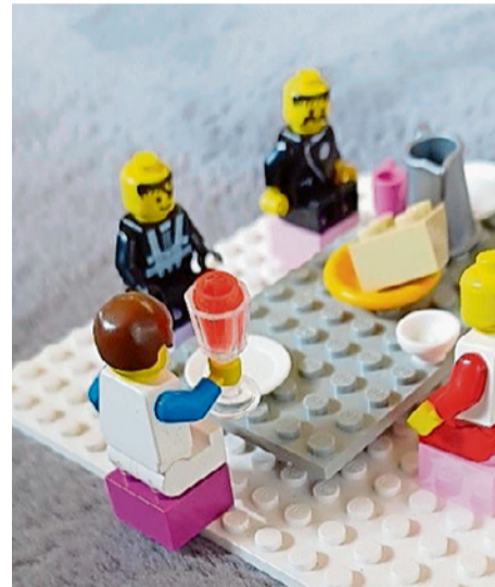
Das Letzte Abendmahl.