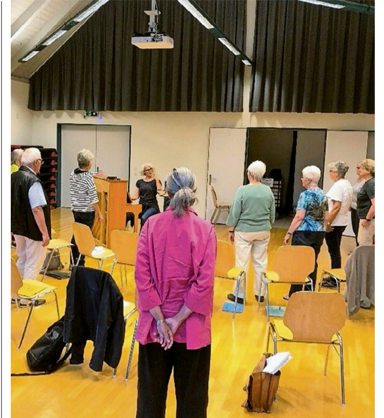
Chor bei der Probe für das letzte Projekt.