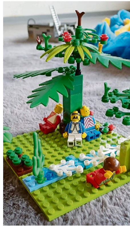
Im Garten Gethsemane.