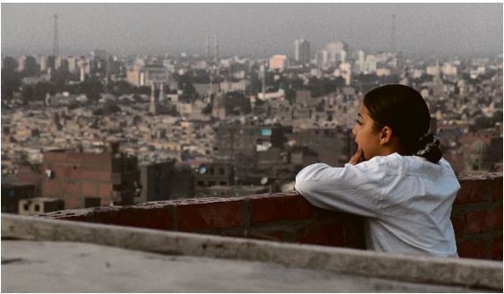
Weltweit werden Menschen wegen ihres Glaubens verfolgt.