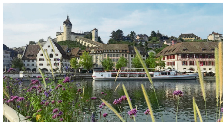
Oben thront der Munot und unten fliesst der Rhein.

Am Sonntag, dem 14. Juni, feiern wir hoch über der Stadt und dem Rhein den traditionellen ökumenischen Munot-Gottesdienst mit Beginn um