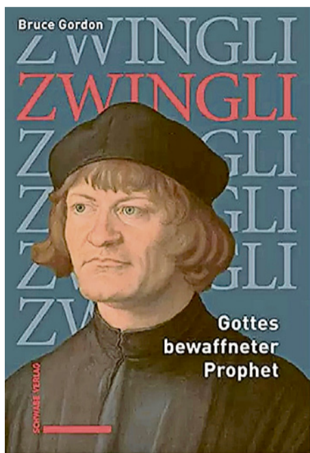
Bruce Gordons Zwingli-Biografie erscheint auf Deutsch, übersetzt von Andreas Berger.

Gordon zeigt einen Reformator, der den Stadtstaat Zürich nicht bloss als günstigen politischen Rahmen nutzte. Zürich wurde für ihn zum Werkzeug göttlicher Erneuerung. Darin liegt die eigentliche Zumutung. Zwingli wollte nicht einfach eine kirchliche Reform neben dem Gemeinwesen. Er wollte das Gemeinwesen unter die Offenbarung stellen. Wo es darauf ankam, war er bereit, die Eigenlogik des Staatswesens, seinen Frieden und seine Kompromisse dem göttlichen Anspruch zu opfern.