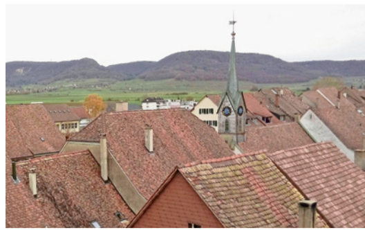
Kirche im Dorf. S. LEISTNER BAUMGARDT