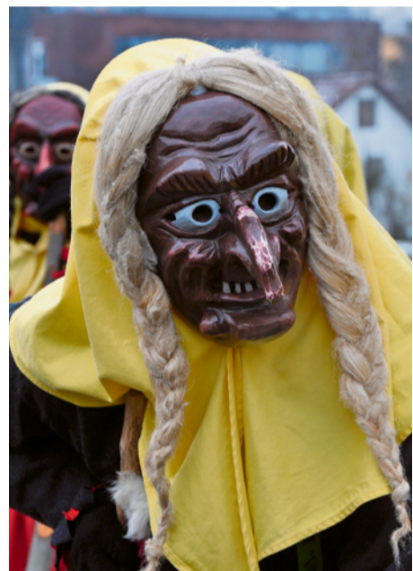
NZ d'Dammglonker

Auch ohne Verkleidung zeigen wir selten ganz, wer wir sind. Vieles bleibt verborgen – vor anderen und manchmal sogar vor uns selbst. Im Alltag treten wir in Rollen auf: mal freundlich, mal souverän, mal belastbar, mal stark. Und selbst wenn wir ganz «wir selbst» sein möchten, bleibt oft etwas Unausgesprochenes. Ein Rest, der sich nicht einfach zeigen lässt.