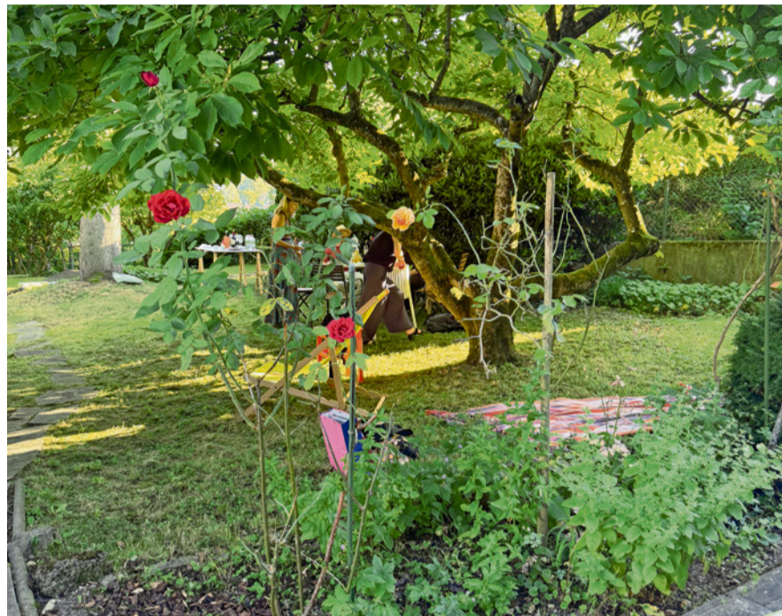
Paradies auf Erden: Was soll wachsen, was darf entstehen? BALDINGER

Doch philosophisches Nachdenken half mir nicht weiter, meine bescheidenen biologischen Kenntnisse auch nicht, und so suchte ich Rat in der Bibel. In Matthäus 13 wurde ich fündig. Im Gleichnis von der wachsenden Saat entdeckte die Knechte des Hausherrn, dass unter dem gesäten Weizen viel Unkraut wächst. Es ist meine Geschichte! Eifrig fragen sie den Hausherrn, ob sie gehen sollen, um es auszureissen. Dieser antwortet: «Nein, damit ihr nicht, wenn ihr das Unkraut ausreisst, auch den Weizen mit herauszieht. Lasst beides miteinander wachsen bis zur Ernte.» Dieser Ratschlag gefiel mir ausserordentlich, denn so konnte ich mich mit gutem Grund angenehmeren Aufgaben zuwenden. Ich legte mich in die Hängematte.