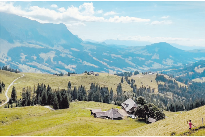
Am 6. Juli feiern wir auf der Alp Imbrig einen Berggottesdienst.