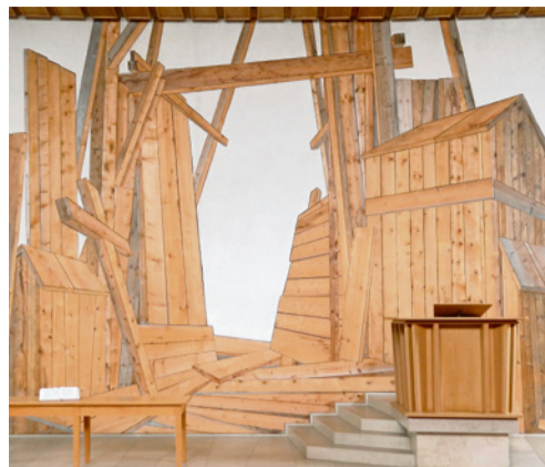
Das grosse Intarsienbild im Gemeindehaus Stephanus trägt den Titel «Durchbruch».