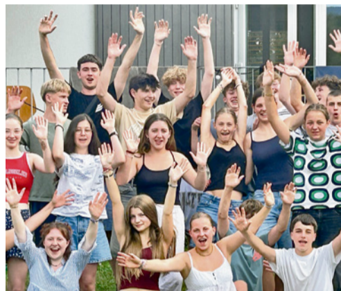
So fröhlich ging es im Sommerlager 2024 zu.