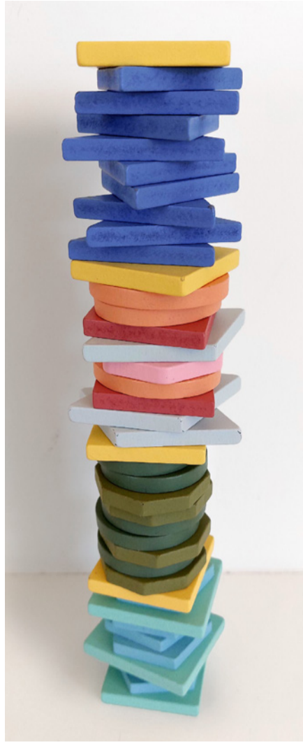
Vierzig Tage zwischen Ostern und Auffahrt – von aussen bedrängt, wächst von innen Schicht um Schicht Zuversicht in der Gemeinschaft mit Christus.

Der vielleicht gewagte Vergleich der nachösterlichen Zeit mit der Vorgeschichte des berühmten Zweikampfs zeigt vor allem eines: Es lohnt sich, uns geschenkte Fristen in geduldiger Zuversicht und in der Gemeinschaft mit Christus zu nutzen.