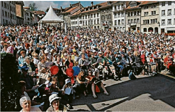
MESSE ALLEMANDE FRIBOURG 2007