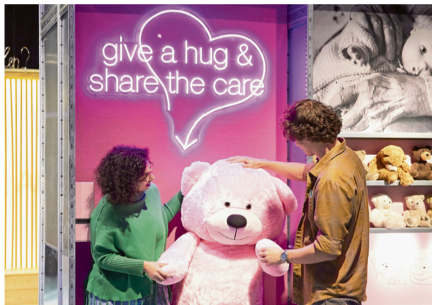
Ausstellung «Hauptsache gesund» im Stapferhaus Lenzburg.