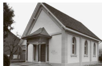
Kapelle Rickenbach. www.baselstaden.ch

Sonntag, 31. Mai, 10.15 Uhr, in der reformierten Kirche