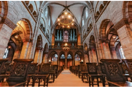
Das Advents-Orgelkonzert lädt zum Mitsingen ein.