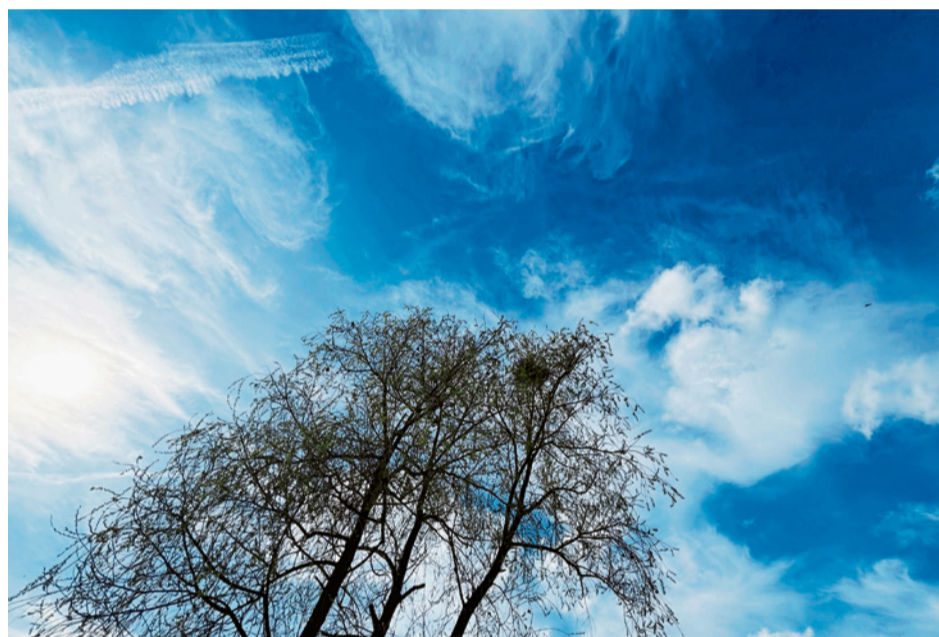
Das Lebendige feiern – auf dem Weg nach Pfingsten. NICOLE RUSSENBERGER