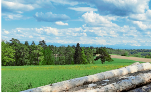
Frühlingstag auf dem Randen. BEAT WANNER