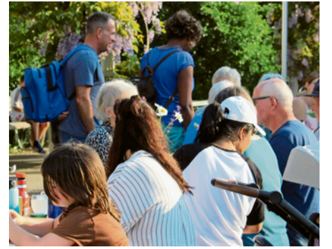
Tavolata 2025: Unvergesslich. GHERKE

Von Zeit zu Zeit spricht Gott uns an. Holt uns heraus aus totaler Überforderung oder tödlicher Langeweile und lädt uns ein zum Fest. Mit Gott feiern heisst, sich beschenken lassen, sich lieben lassen. Erinnert uns daran, dass es noch anderes als Arbeit, Leistung und Pflichten gibt. Dass trotz allem, was uns Angst und Sorge macht, es Grund zur Freude, zum Feiern gibt. Weil der Tod und die Langeweile nicht Macht über uns gewinnen sollen. MIRIAM GEHRKE