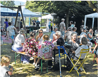
Jung und Alt begegnen sich unter den Bäumen des Parks

Samstag, 23. August, 12 bis 22 Uhr, Vögelgarten hinter der Friedenskirche