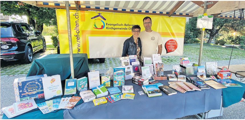
Alle Jahre wieder mit dabei.