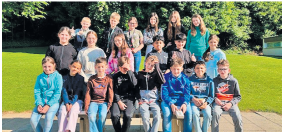
Klasse 5b aus Wangen ist schlicht klasse!

Wie das Sprichwort sagt: «Es geht noch viel Wasser die Aare runter!» – Und so ist auch in Bezug auf die Zukunft des Religionsunterrichts im Kanton Solothurn noch viel Bewegung möglich. In diesem Sinne wünsche ich Ihnen allen eine sonnige, herrliche Sommerzeit. Tragen Sie Sorge zu sich und Ihren Lieben. DORIS BÜRGI-SMONIG, FACHSTELLE RELIGIONSUNTERRICHT GESAMTKIRCHGEMEINDE