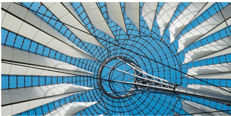
In den Himmel schauen. U. SCHÜRCH

Anwil – Kienberg – Kilchberg – Oltingen – Rothenfluh – Rünenberg – Wenslingen – Zeglingen