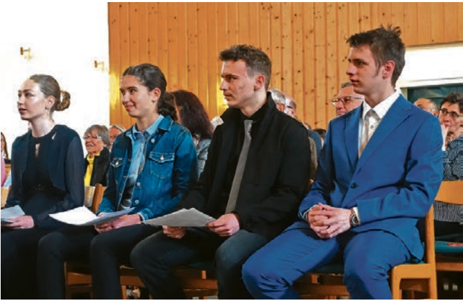
Konfirmation 2024.

Angesprochene Kirchgemeinden (Beg): Beggingen, (Hall): Hallau, (Gäch): Gächlingen, (Lô-G): Löhningen-Guntmadingen (Sib): Siblingen, (Schl): Schleitheim, (Neu): Neunkirch (Ober): Oberhallau, (TOW): Trasadingen-Osterfingen-Wilchingen