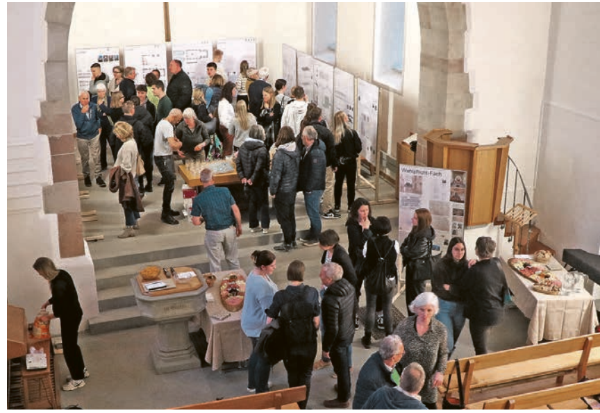
Ausstellung der Projektarbeiten in der Städtlikirche Neunkirch.