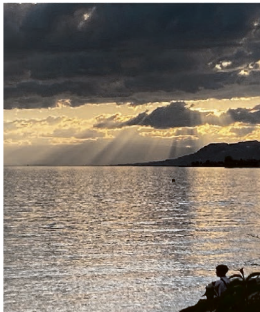
Pfingsten – halten Sie doch mal inne: Spüren Sie die Kraft des Heiligen Geistes? Durch ihn dürfen wir die Liebe Gottes erfahren.