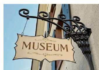
Fahrt ins Dorfmuseum Ettingen.