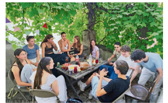
Sommerfest der Jugend am Münster.

Sommerfest: Freitag, 19. Juni, 19.30 Uhr