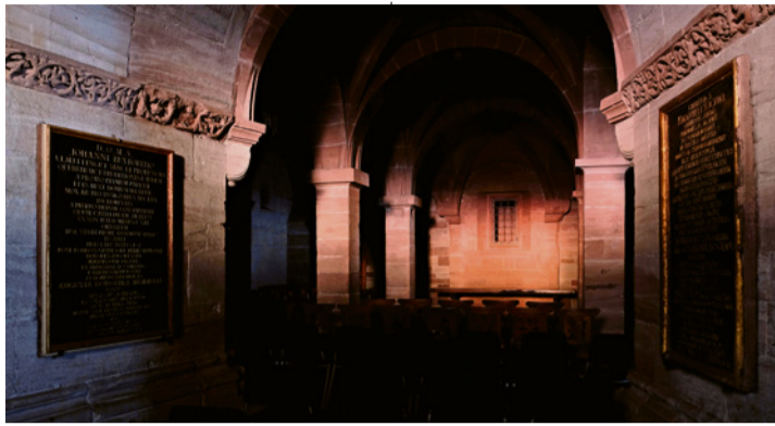
Die Krypta in den ersten Sonnenstrahlen. MARTIN BÜTIKOFER