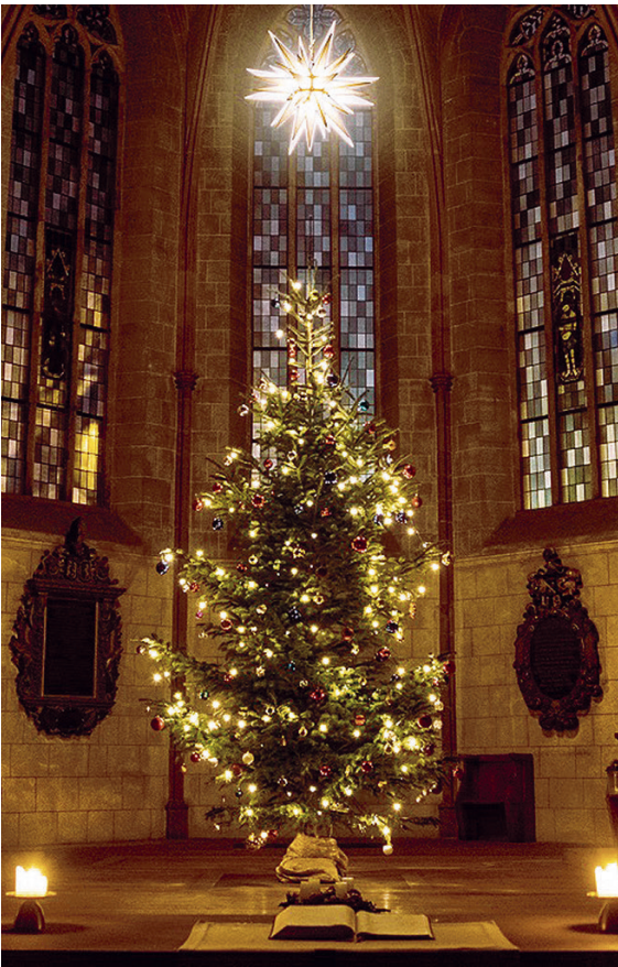
Weihnacht im Kleinbasel.